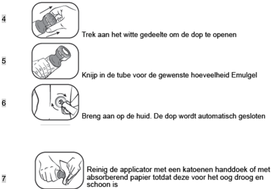
Figuur 2: Doseer- en smeerdop instructie stap 4 t/m 7

Gebruik de applicator niet opnieuw voor een andere tube. Volg bij het weggooien van de tube de in uw land geldende regels voor het weggooien van medicijnen.