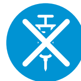
Geef niet de geplande dosis parenteraal anticoagulans