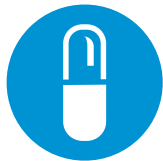
Laatste dosis dabigatran