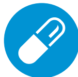
Start met dabigatran 0-2 uur vóór de volgende geplande dosis parenteraal coagulans