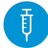
Start met parenteraal anticoagulans en stop met dabigatran